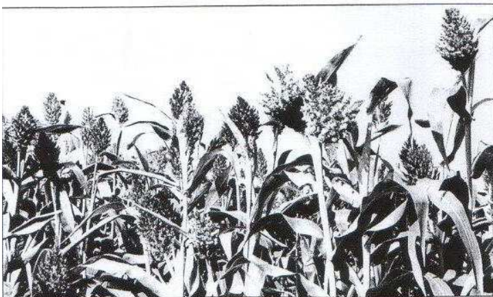
Čirok je vynikajícím zdrojem energie